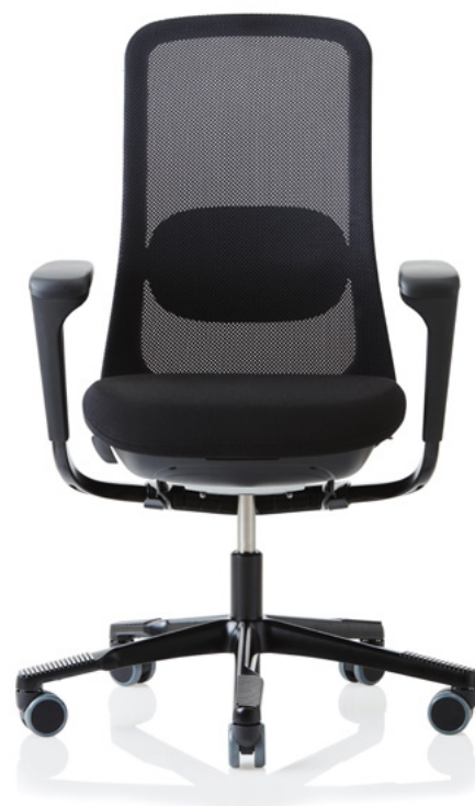
Design: Frost Produkt AS, Powerdesign AS und Flokk Design Team Patent- und Designgeschützt.