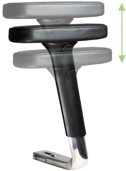
Armlehne 1F Leder eckig (4er - 6er Reihe)

(Die Breite kann bei diesen Armlehnen mit einem Werkzeug angepasst werden.)