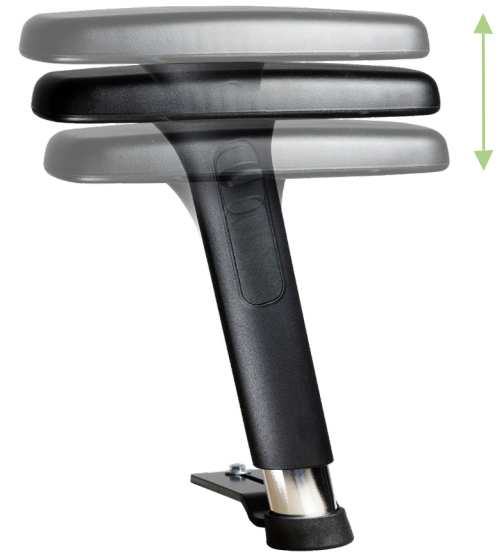
Armlehne 1F PUR lang (2er - 3er Reihe)