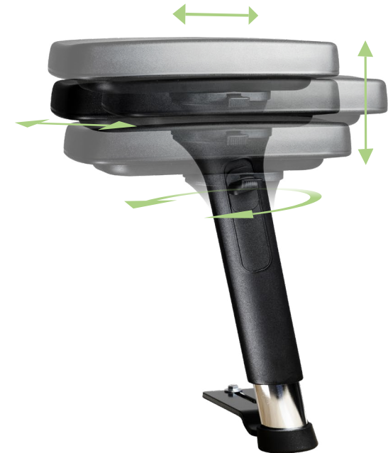
Armlehne 4F PUR lang (2er - 3er Reihe)