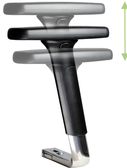
Armlehne 1F PUR eckig (4er - 6er Reihe)